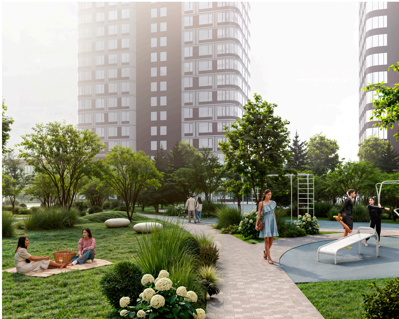
ВИЗУАЛИЗАЦИИ ПРЕДВАРИТЕЛЬНЫЕ, ВОЗМОЖНЫ ИЗМЕНЕНИЯ

ПЛОЩАДЬ ДВОРА 1,15 ГА ДЕТСКИЕ ПЛОЩАДКИ МОЛОДЕЖНОЕ ПРОСТРАНСТВО ВОРКАУТ-ЗОНА ВСЕСЕЗОННЫЙ ЛАНДШАФТНЫЙ ДИЗАЙН