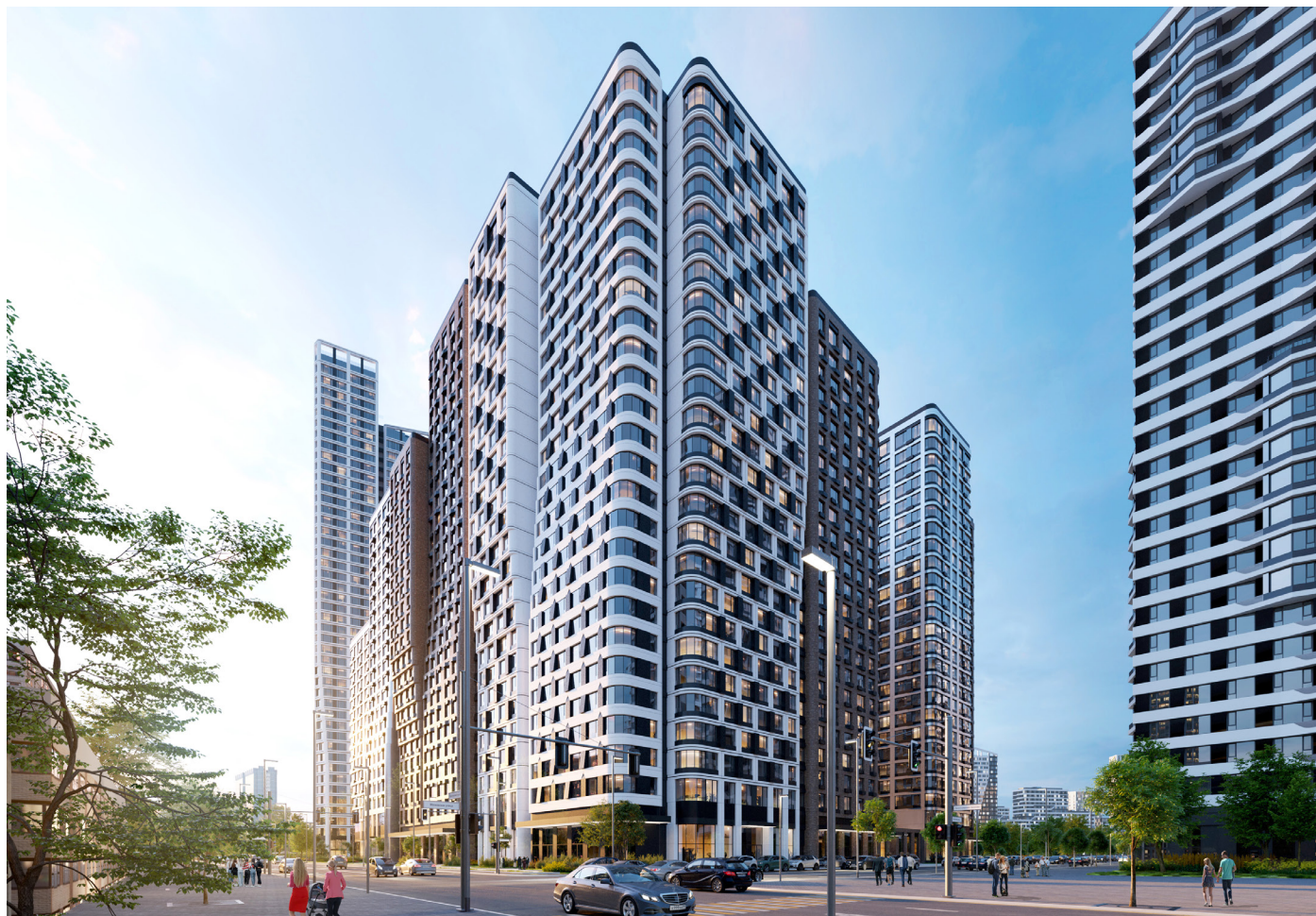
ВИЗУАЛИЗАЦИИ ПРЕДВАРИТЕЛЬНЫЕ, ВОЗМОЖНЫ ИЗМЕНЕНИЯ

«Гордость» – заключительный этап проекта СИМВОЛ. Новый квартал вобрал в себя лучшее, что было реализовано за время развития СИМВОЛА: узнаваемую бионическую архитектуру, продуманные планировки квартир, дизайнерские лобби, общественные пространства на любой вкус, стильное благоустройство дворов.