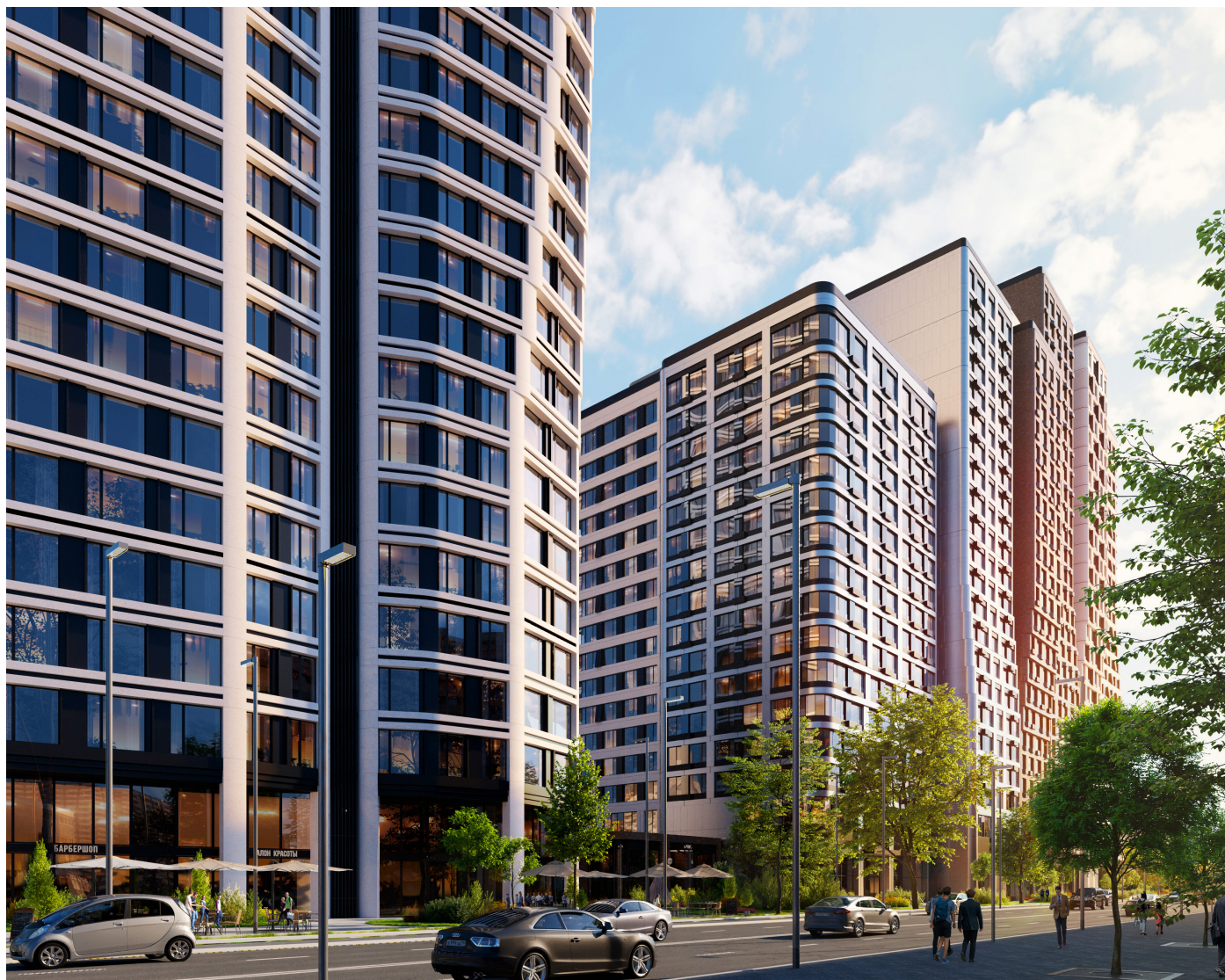
ВИЗУАЛИЗАЦИИ ПРЕДВАРИТЕЛЬНЫЕ, ВОЗМОЖНЫ ИЗМЕНЕНИЯ